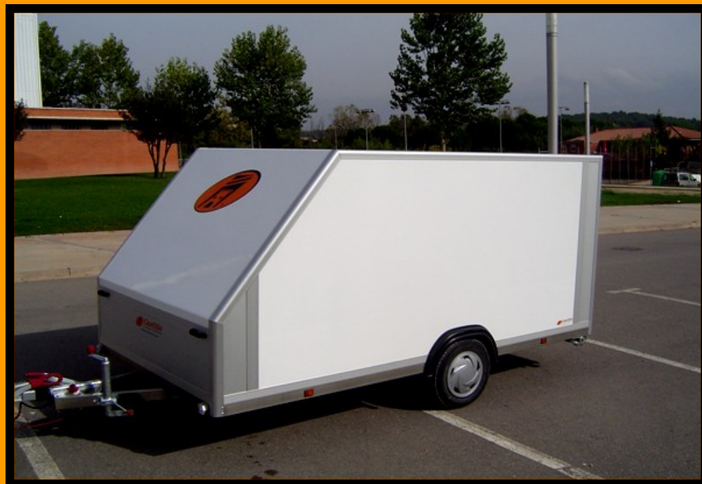
Remolque ligero categoria O1